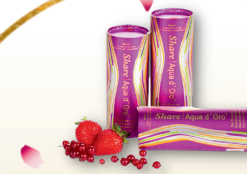
Share Aqua d'Oro напій із ферментованих фруктів та овочів