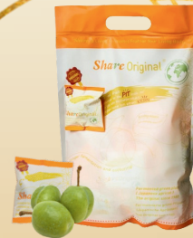
Share Original Ферментований абрикос (PRUNUS MUME)