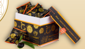
Share Pomelozzini Ферментований помело (Помелоцціні)